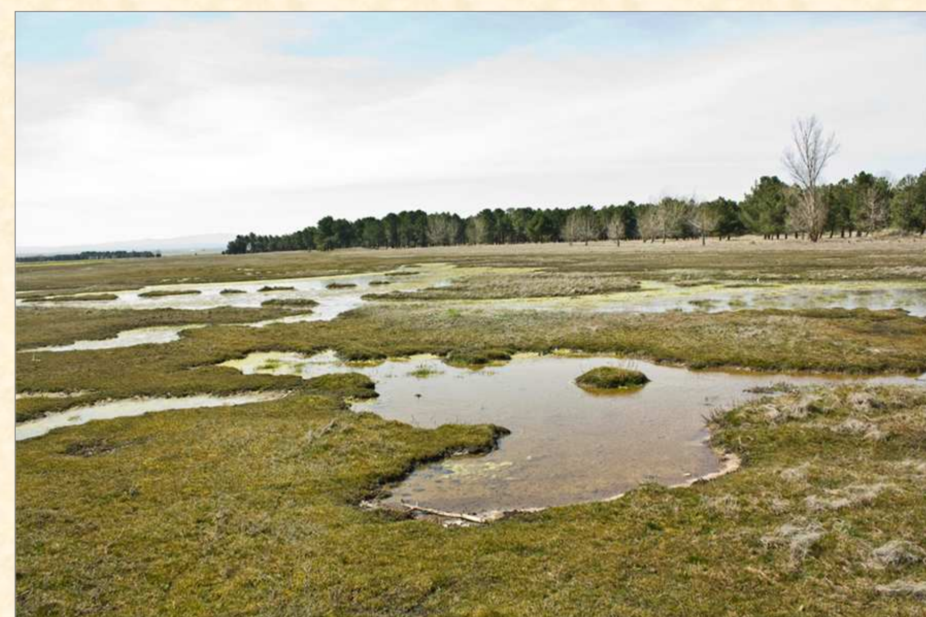
FIGURA 2: Lagunazos junto al pinar en la zona norte del término municipal de El Oso.

Los análisis edáficos han sido completados con un estudio ANOVA y LSD de Tukey