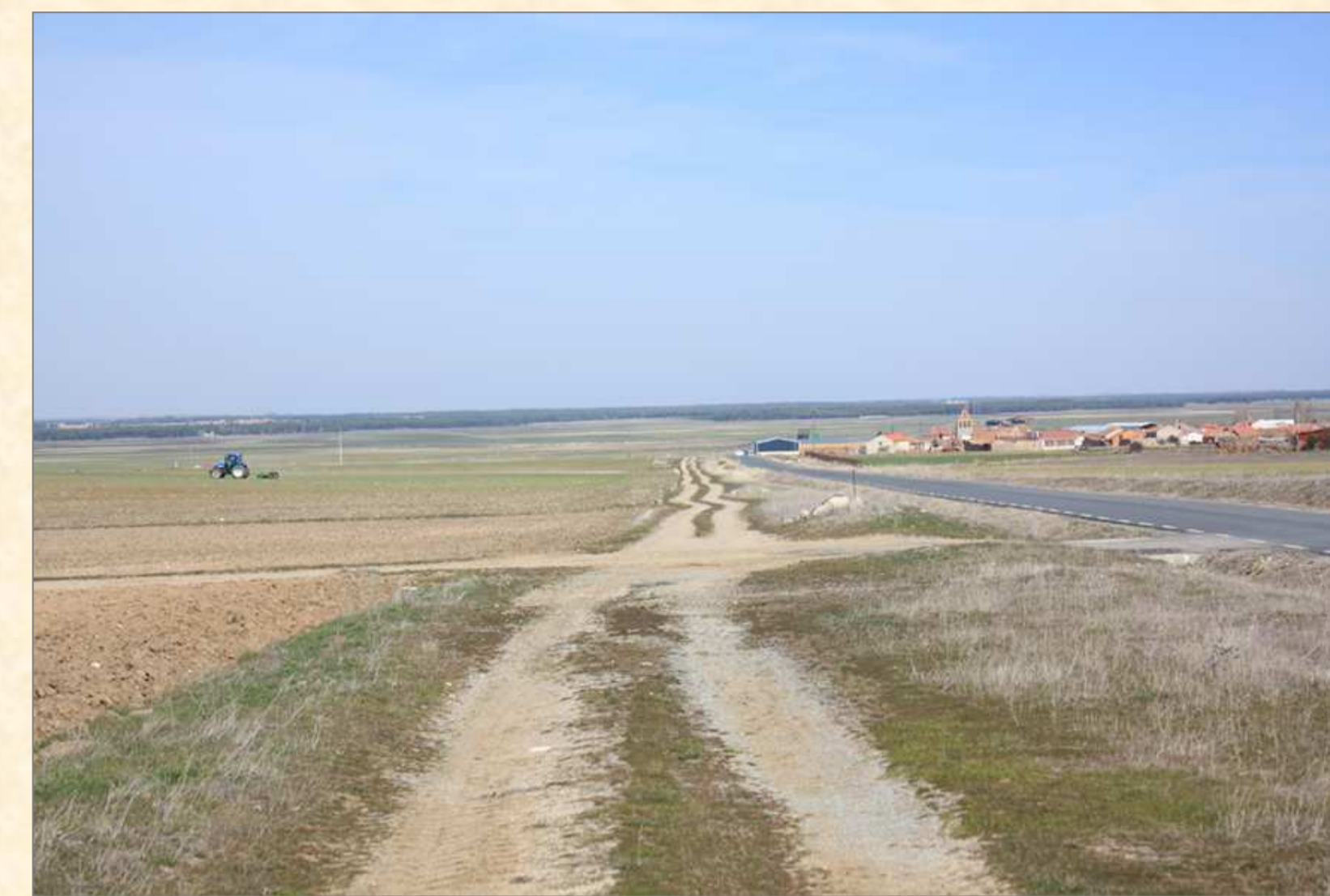
FIGURA 1: Visión del municipio de El Oso desde la zona denominada “Las Cuestas” situada al sur.

Presentamos a continuación los primeros resultados sobre la estructura vegetal del término municipal de El Oso en la provincia de Ávila. Los objetivos que nos hemos marcado son describir la estructura de la cubierta vegetal y caracterizar las diferentes comunidades que componen el mosaico vegetal del municipio. Todo esto va a implicar el aumento del conocimiento florístico de la región donde se ubica el municipio que se conoce como “La Moraña”, lugar intensamente antropizado por su aprovechamiento ganadero, y sobre todo, agrícola.